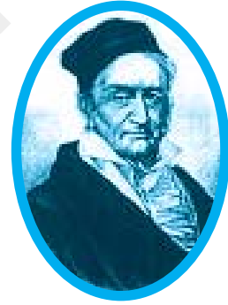
कार्ल फ्रैड्रिक गॉस (1777 – 1855)

अंकगणित की आधारभूत प्रमेय के रूप में विख्यात होने से पहले, प्रमेय 1.2 का संभवतया सर्वप्रथम वर्णन यूक्लिड के एलीमेंट्स की पुस्तक IX में साध्य (proposition) 14 के रूप में हुआ था। परंतु इसकी सबसे पहले सही उपपत्ति कार्ल फ्रैड्रिक गॉस (Carl Friedrich Gauss) ने अपनी कृति डिसक्विशंस अरिथमेटिकी (Disquisitiones Arithmeticae) में दी। कार्ल फ्रैड्रिक गॉस को प्रायः 'गणितज्ञों का राजकुमार' कहा जाता है तथा उनका नाम सभी समयकालों के तीन महानतम गणितज्ञों में लिया जाता है, जिनमें आर्किमिडीज़ (Archimedes) और न्यूटन (Newton) भी सम्मिलित हैं। उनका गणित और विज्ञान दोनों में मौलिक योगदान है।