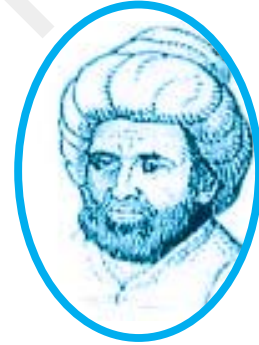
मुहम्मद इब्न मूसा अल-ख्वारिज़्मी (780 – 850 ई.)

प्रमेयिका एक सिद्ध किया हुआ कथन होता है और इसे एक अन्य कथन को सिद्ध करने में प्रयोग करते हैं।